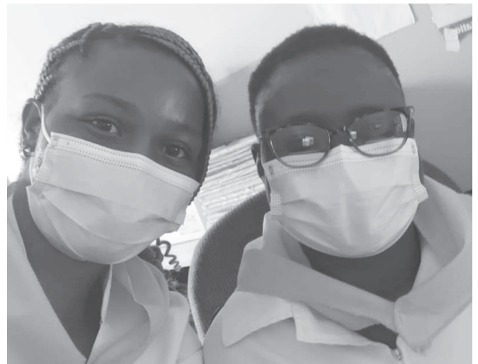
Allievi al St'Albert

Zimbabwe - Siamo molto riconoscenti al Signore che ha risparmiato alcune parti dell'Africa da questa piaga della pandemia che è stata così pesante in tutto il mondo. Anche nella missione di St. Albert's la pandemia non è stata disastrosa, ma la chiusura totale del paese ha causato tanta fame, miseria e disagi scolastici che si stanno superando pian piano. L'ospedale di St. Albert's ha fatto la sua parte nel combattere la pandemia agevolando le misure di prevenzione nei villaggi attraverso l'informazione e distribuendo vari materiali di prevenzione, dedicando le corsie per i pazienti affetti da covid 19 e facilitando la possibilità delle quarantene. L'ospedale sta continuando con i vaccini. L'aiuto alimentare e di medicinali è stato di grande aiuto durante questi mesi. Adesso che hanno cominciato le scuole in presenza stiamo di nuovo seguendo i ragazzi nelle scuole. I piccoli progetti di micro-credito per l'ospedale, stanno andando bene e ci fanno sperare per il futuro anche se non una