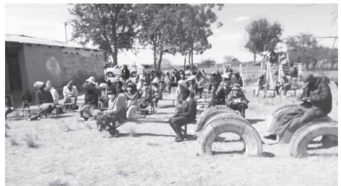
Pazienti che attendono nell'ambulatorio