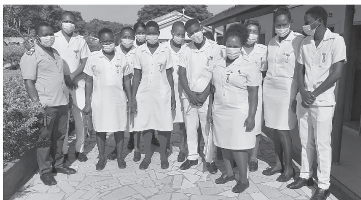
Gli allievi della scuola infermieristica dell'ospedale St.Albert's