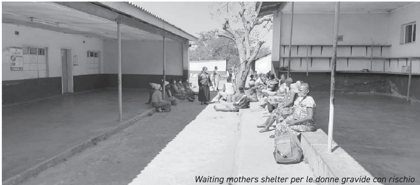
Waiting mothers shelter per le donne gravide con rischio

autonomia totale, almeno uno sforzo di auto mantenimento.