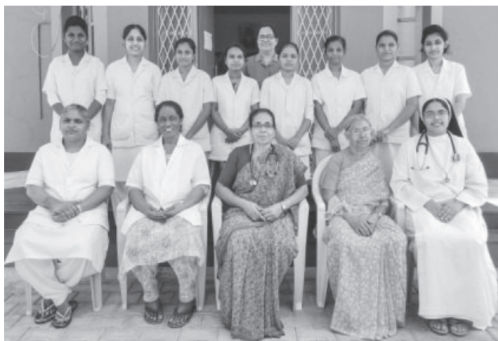
India Staff dell'ospedale Amala Matha