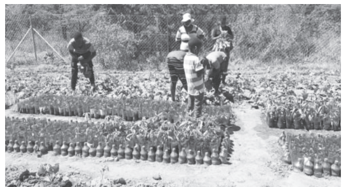
Giovani impegnati durante il periodo lock-down nella coltivazione di piante e verdure per la vendita